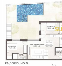
PB / GROUND FL.